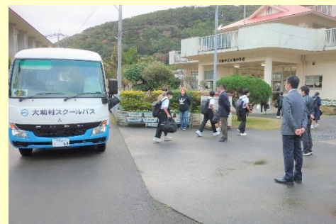
【16日(月) PTA生活指導部による 朝のあいさつ運動】