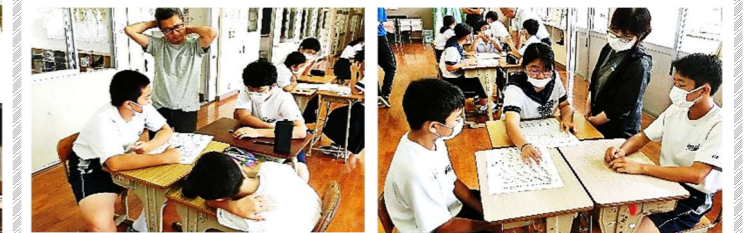
【みんなで楽しく問題を解く「結」の時間の様子】