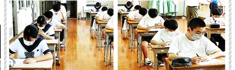
【真剣に問題に取り組む「大和中検定」の様子】

少人数だからこそできる取り組みで、生徒たちは基礎学力やコミュニケーション能力を高めています。